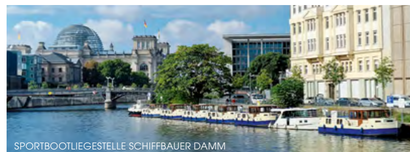
SPORTBOOTLIEGESTELLE SCHIFFBAUER DAMM